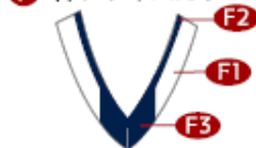
F 衿フライスカラー